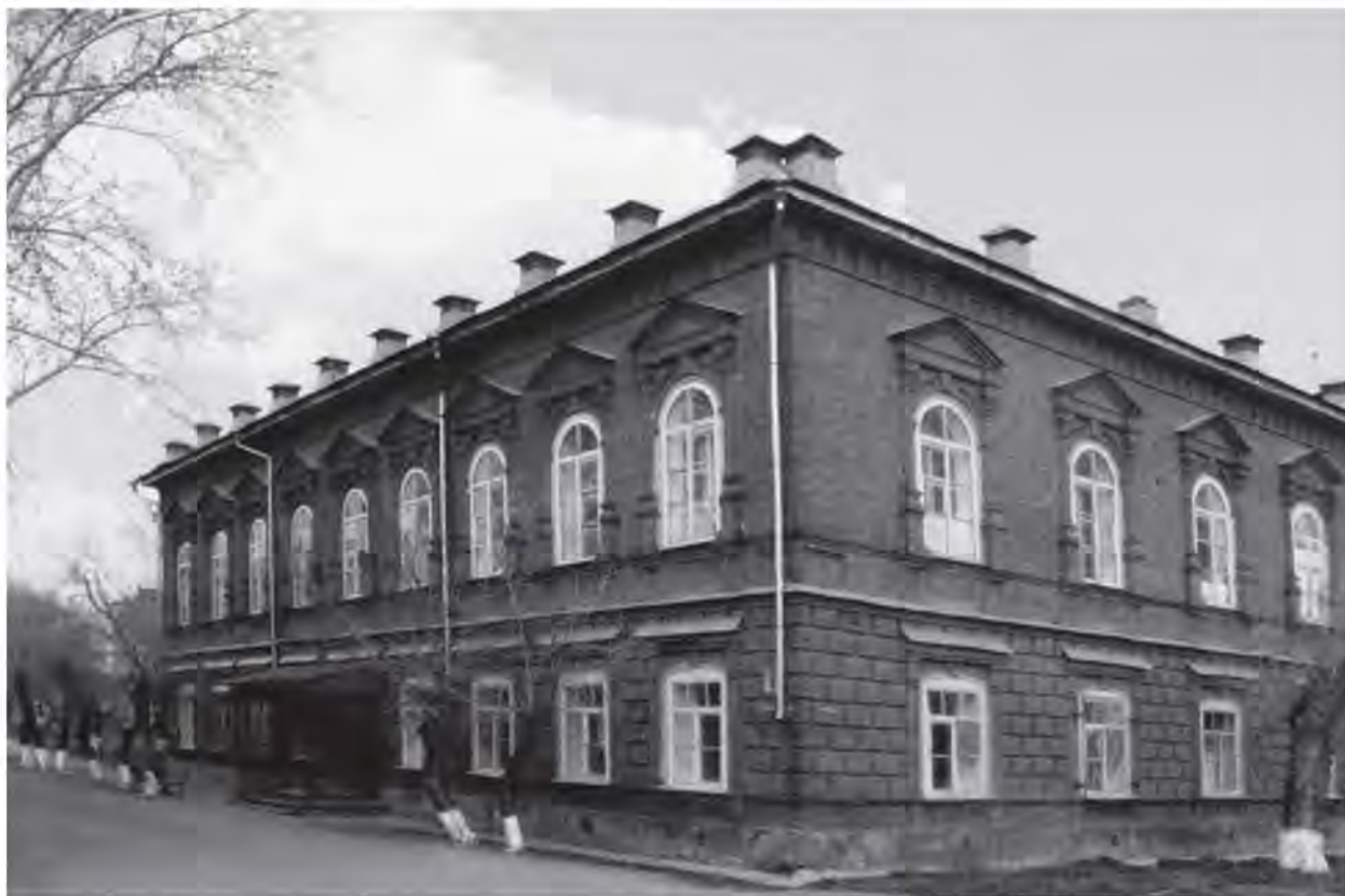
Земская управа. 1875 г.

всю грандиозность и величие этих пространств и расстояний, а заодно поразится и восхитится подвигу строителей этой великой железной дороги. Строительство Транссиба началось в 1891 году с Челябинска на Курган, Новосибирск, Омск и далее. Создать такое мог только русский народ. Начав освоение пространств северной Сибири, россияне одновременно приступили к освоению земель за Уралом. Земля здесь плодородна, а климатические условия их устраивали. Таким образом, потомки ранее живших в этих местах «чуди белоглазой» и славян через много сотен лет вернулись на свою прародину. Так удивительным образом замкнулся цикл перемещения преобразованного народа.