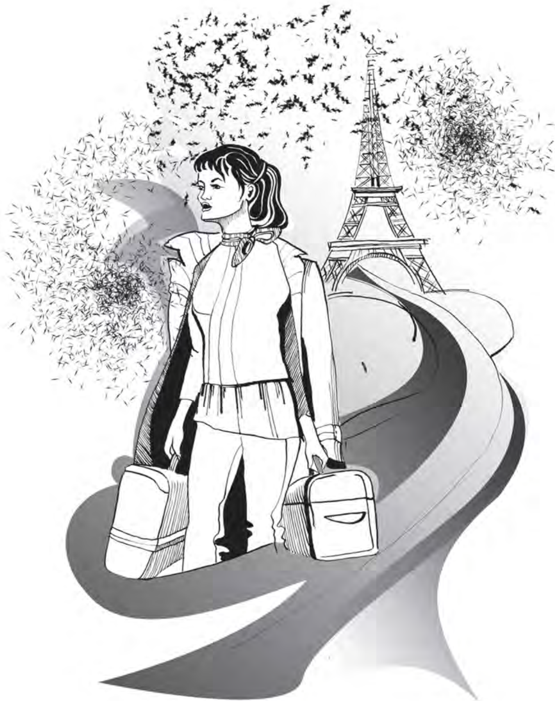
Рис. А. Митрофановой

на месте без особых проблем, — выразила я свое мнение.