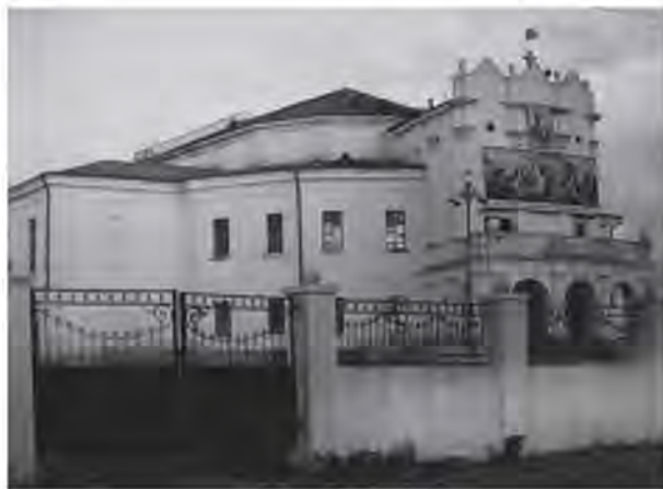
Дом культуры в пос. Полуночном