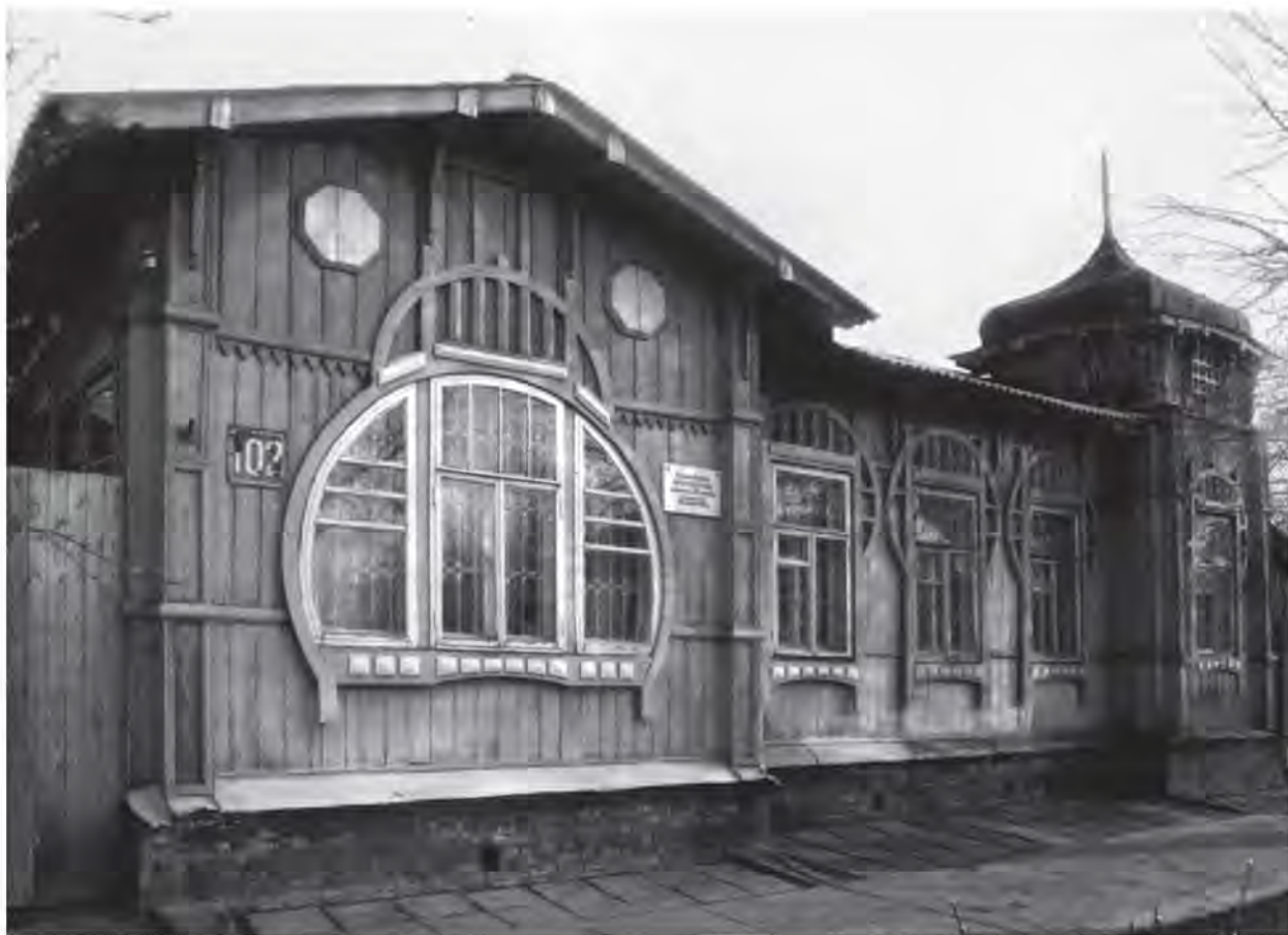
Дом А.П. Ночвина. 1914 г.

бросок на запад калмыков, начавшийся в начале XVII века из степей Монголии в низовья Волги. Это единственный в Европе ареал обитания народности, говорящей на монгольском языке и исповедующей одну из великих мировых религий – буддизм.