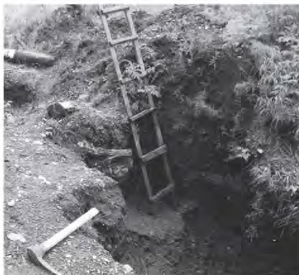
Шурф на р. Малой Бобровке

Сейчас около горы Соловьевой работает предприятие «Нейва». В книге «Зеленые горы, пестрый