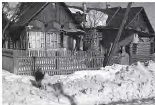
Жилые дома в пос. Полуночном

В 1939 г. было закончено строительство железной дороги Лангур – Ивдель 1 (раннее этот путь преодолевался за двое и более суток) и Палкино – Першино (1940 г), началось строительство ж.д. ветки Ивдель 1 – Каменка (в будущем – Полуночное).