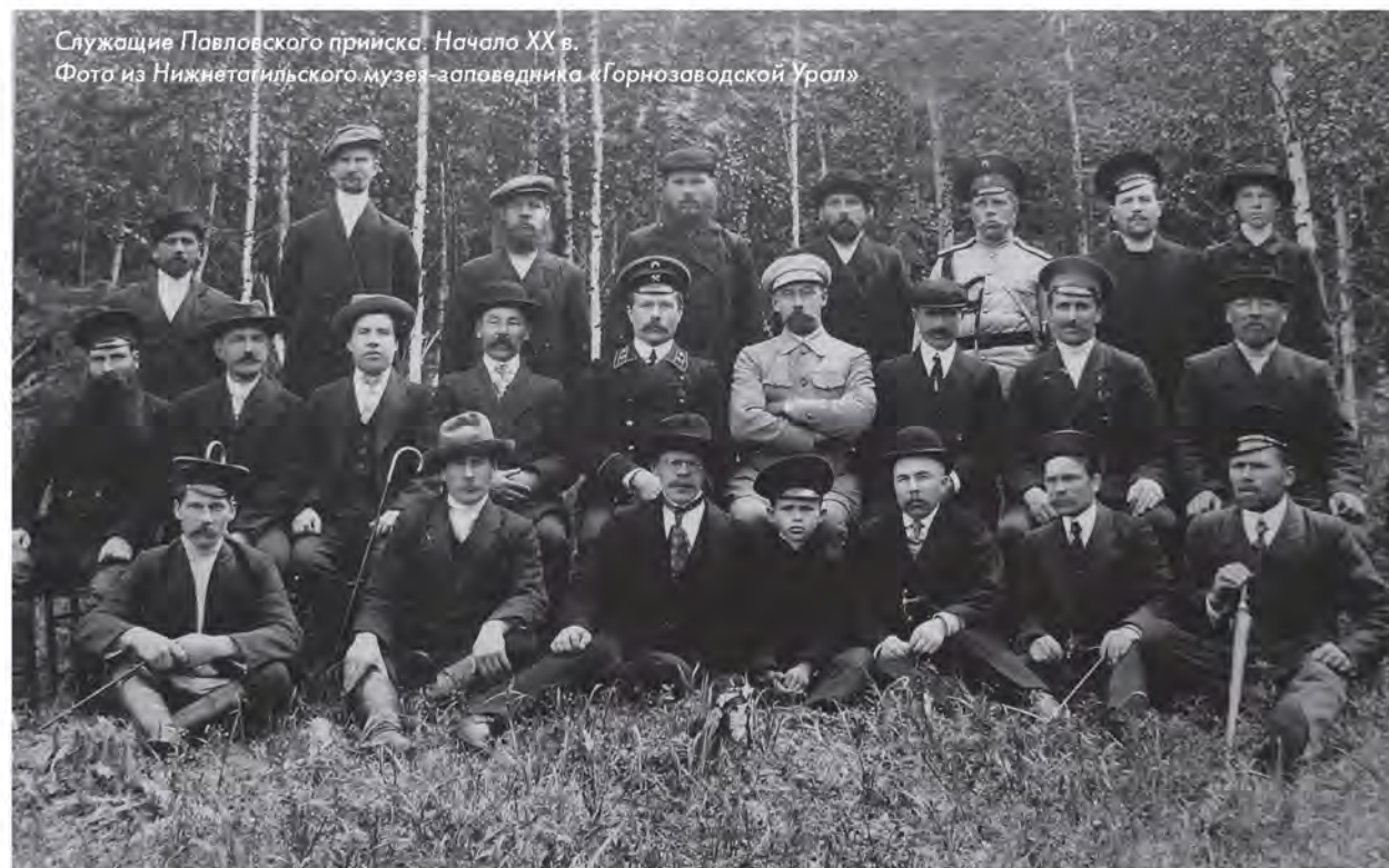
Служащие Павловского прииска. Начало XX в.