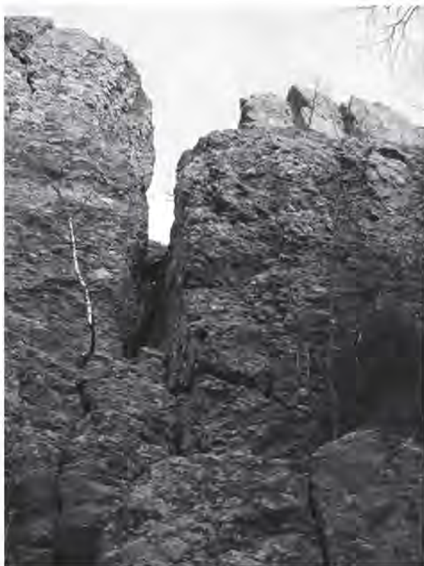
Останцы на вершине г. Шунут

А еще говорят, что настоящее название скалы не «Олений», а «Аленин». Такую фамилию носил Ермак. Взобрался на утес Тимофеевич, поглядел на восток — не видать ли за горами Кучумова царства. Три дня смотрел и три ночи думал, как быть. И пошел со своим войском по реке Серебряной (Серебрянке), которая протекает поблизости.